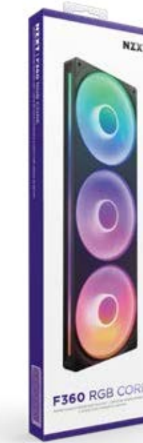
F360 RGB CORE