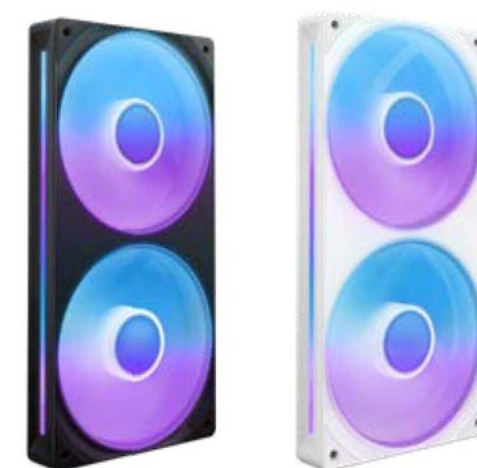
F240 RGB CORE