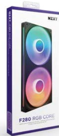
F280 RGB CORE