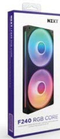
F240 RGB CORE