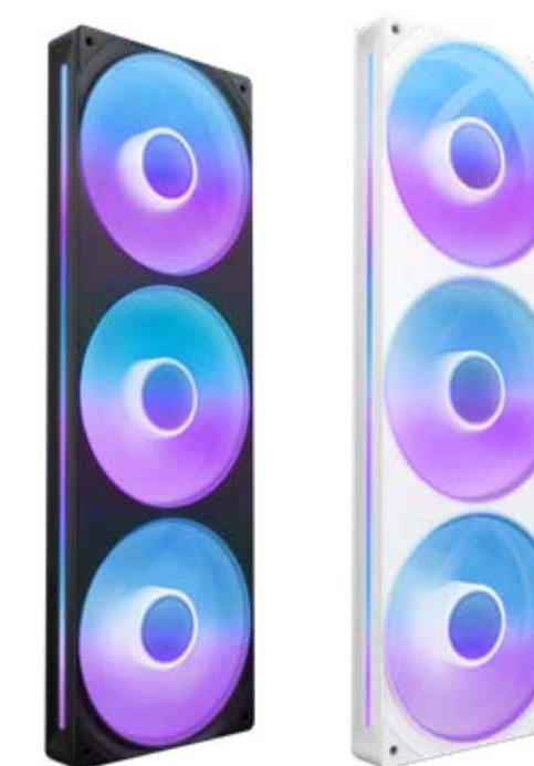
F360 RGB CORE