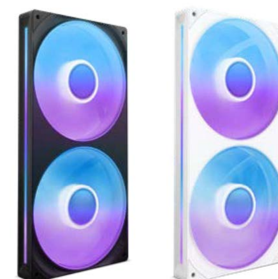
F280 RGB CORE